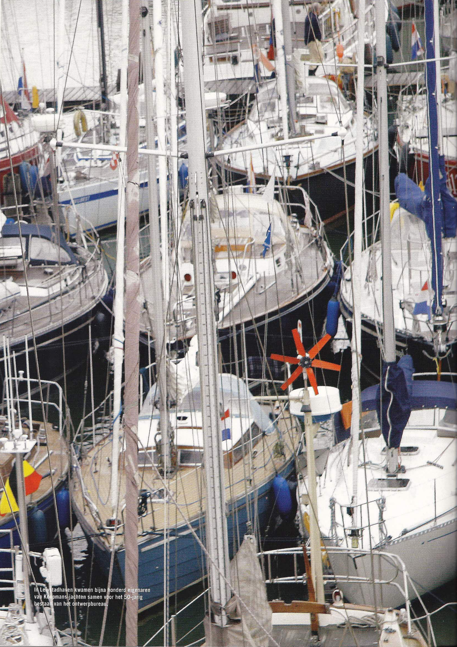
In Lelystadhaven kwamen bijna honderd eigenaren van Koopmans-jachten samen voor het 50-jarig bestaan van het ontwerpbureau.